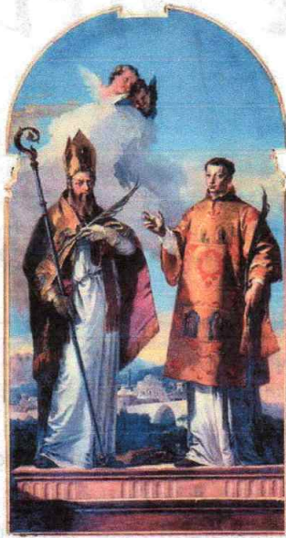
G.B. Tiepolo I santi Ermacora e Fortunato. Cattedrale di S. Maria Assunta (Udine), cappella dei Santi Patroni.

I due santi sono anche i protettori della città di Udine.